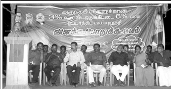
சமூகநீதி பரப்புரை பயணத்தை தொடங்கி வைத்து அதியமான் உரை.