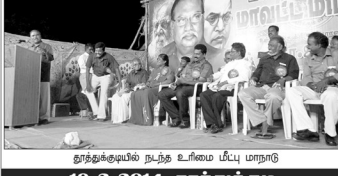
தூத்துக்குடியில் நடந்த உரிமை மீட்பு மாநாடு