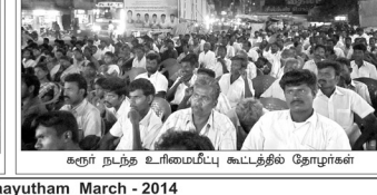
கரூர் நடந்த உரிமைமீட்பு கூட்டத்தில் ஜோசு