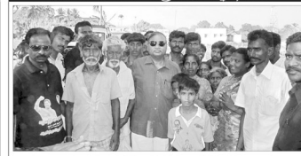
மதுரை புறநகரில் மக்கள் வரவேற்பு