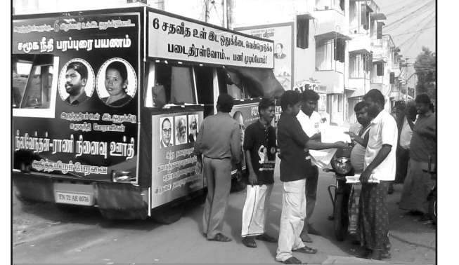
6 சதவீத உள் இட ஒதுக்கீட்டிற்கான விழிப்புணர்வு ஊர்தியில் துண்டறிக்கையை மக்களுக்கு வழங்கும் தோழர்கள்