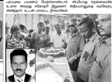
திருப்பூரில் பரப்புரை பயணம் நிறைவிழிப்புள்ளி நிதிச்செயலாளர் நிறுவனமாவல் உரை. மேலையில் நிறுவன அதியமான் மாவட்ட செயலாளர் தமிழ்வேந்தன் மற்றும் ஜோசு