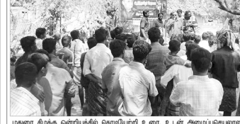
மதுரை கிழக்கு ஒன்றியத்தில் கொடியேற்றி உரை. உடன் அமைப்புத்தலைவர்கள்