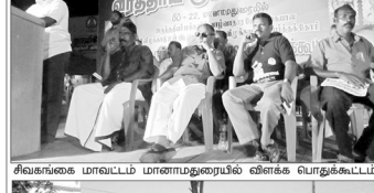
சிவகங்கை மாவட்டம் மானாமதுரையில் விளக்க பொதுக்கூட்டம்