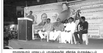
ராமநாதபுரம் மாவட்டம் பரமக்குடியில் விளக்க பொதுக்கூட்டம்