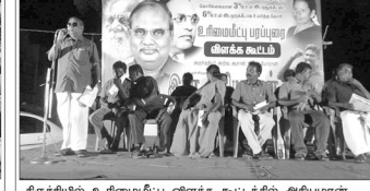
திருச்சியில் உரிமைமீட்பு விளக்க கூட்டத்தில் அதியமான் சே.க. மேலையில் மாவட்ட மாநில நிர்வாகிகள்