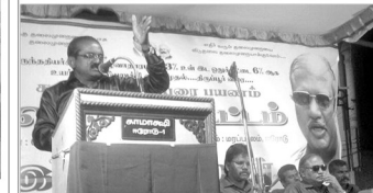
சேலம் மாநகரில் மக்கள் வரவேற்பு