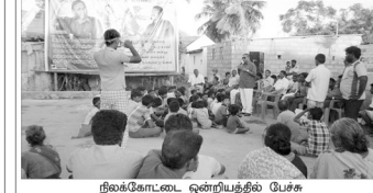
நிலக்கோட்டை ஒன்றியத்தில் சே.க.