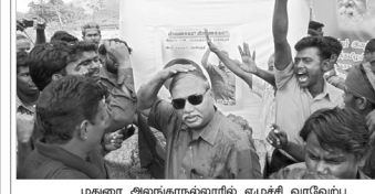
மதுரை அமைச்சரவை அறையில் எழுச்சி வரவேற்பு