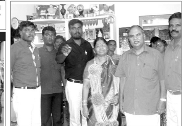
அருந்ததியர்களுக்கு 6 சதவீத இட ஒதுக்கீடு வழங்க வலியுறுத்தி பரப்புரை பயணம் மேற்கொண்டார். அப்போது நெல்லைவில் உள்ள வலையு சேனாரி நிறுவனம் அதியமானுக்கு வரவேற்பு அளித்தார். உடன் மாவட்ட நிர்வாகிகள்