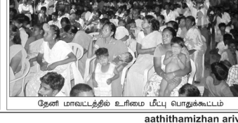
தேனி மாவட்டத்தில் உரிமை மீட்பு பொதுக்கூட்டம்