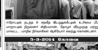
சீரோடு நடந்த 6 சதவீத இட ஒதுக்கீட்டின் உரிமை மீட்பு மாநாட்டில் திருவள்ளூர் அதியமான் சே.க. மேலையில் மாவட்ட, மாநில நிர்வாகிகள் ஆடியோ கைநாடு கொண்டனர்.