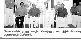
கோவை நடந்த மாநில செயற்குழு கூட்டத்தில் பொருள் அமைச்சர் அ.பி.சேனார்