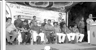
சேலம் மாநகரில் மக்கள் வரவேற்பு