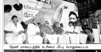
தேனி மாவட்டத்தில் உரிமை மீட்பு பொதுக்கூட்டம்