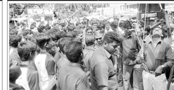
திண்டிவனம் மாநகரில் கொடியேற்றுவிழா