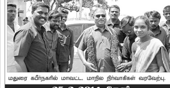
மதுரை கரீரநகரில் மாவட்ட மாநில நிர்வாகிகள் வரவேற்பு